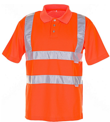
uni orange 2091