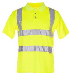
uni gelb 2092