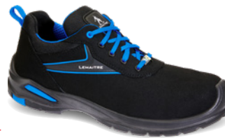
Paul S3 ESD SRC ARTIKELNUMMER : 8075