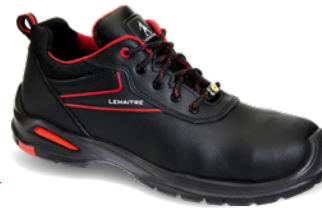
George low S3 ESD SRC ARTIKELNUMMER : 8073